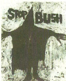
R. Serra, Whitney Biennial 2006

Opbeurend is het niet, de hedendaagse kunst die hip is. Waar je ook kijkt, overal is kunst te zien met een onheilszwangere boodschap. Alsof een catastrofe nakende is.