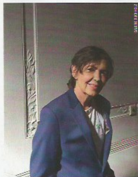
BRUTAAU BEZIT VAN DE RUIMTE Kümmel (1981) en Zwei Lampen (1994).

Genzken aan de kunstacademie in Düsseldorf. 'Breinaalden', zei Richter over de ellipsoïden van Genzken, even provocerend als denigrerend. 'Wapens', kaatste Genzken terug. Een gevalletje van was sich hebt das neckt sich , want in 1982 traden Genzken en Richter in het huwelijk. Het zou stand houden tot 1993. Na de scheiding verruilde Genzken Keulen voor Berlijn, de nieuwe artistieke magneet van Europa. Genzken floreerde in die bruisende biotoop. Ze sloot hechte vriendschappen met jongere kunstenaars als de snapshot-fotograaf Wolfgang Tillmans (1968) en de beeldend kunstenaar en musicus Kai Althoff (1966). In Berlijn legde ze zich toe op assemblages, een techniek die tegenpolen bij elkaar brengt en bij uitstek aansluit bij haar kameleontische karakter.