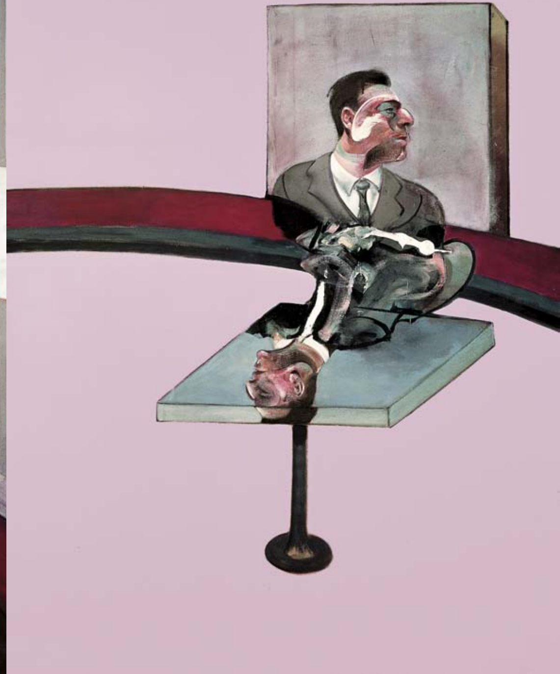
Francis Bacon en zijn geliefde